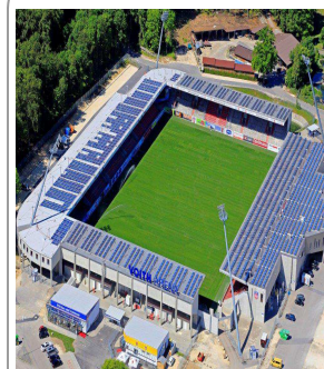
Das Stadion des 1. FC Heidenheim 1846

Wir wünschen dem 1.FC Heidenheim weiterhin sportlichen Erfolg!