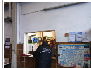
Warenannahme in der Produktion

Außerdem wurde ein besonderes Augenmerk auf die Rückverfolgbarkeit der Ware gelegt, die jetzt noch präziser und effizienter funktioniert und so mehr Sicherheit für unsere Kunden bietet.