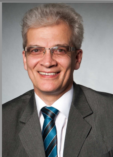
Sehr geehrte Damen und Herren,

neben der Kommunikation mit den Kunden und den Mitarbeitern ist diese mit Politik und Behörden ebenso wichtig. Dazu dienen Messen und ein offenes Ohr für die beiderseitigen Belange.